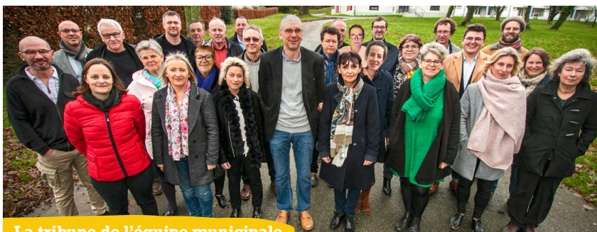
La tribune de l'équipe municipale

Les ventes à la ferme se déroulent tous les mardis soir, de 17 h à 19 h. Contact : 06 48 03 34 61.