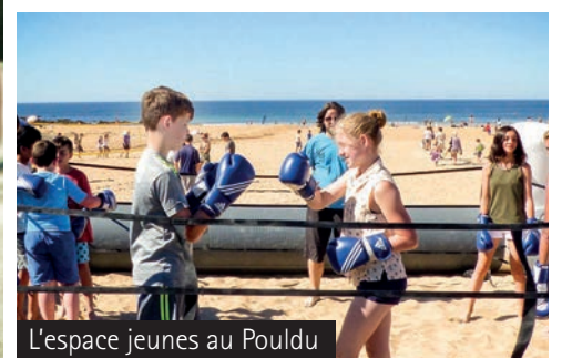
L'espace jeunes au Pouldu