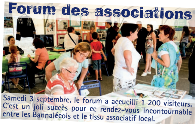
Samedi 3 septembre, le forum a accueilli 1 200 visiteurs. C'est un joli succès pour ce rendez-vous incontournable entre les Bannalécois et le tissu associatif local.

Pour fêter les 30 ans du club, les responsables ont programmé une soirée repas conviviale le samedi 15 octobre 2016, avec une exposition de photographies de ces trois décennies. L'inauguration du nouveau praticable de la salle de gym est prévue ce même jour.