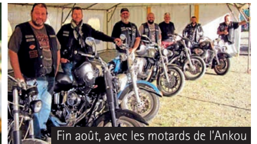
Fin août, avec les motards de l'Ankou