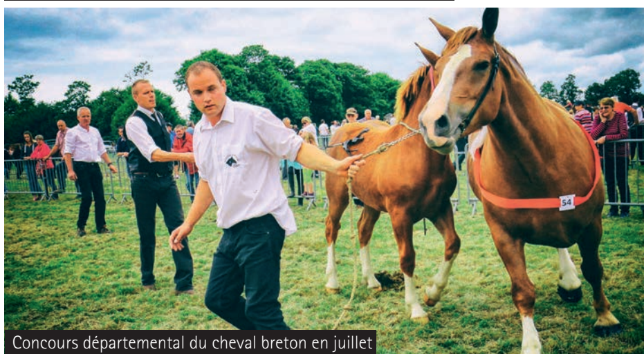
Concours départemental du cheval breton en juillet