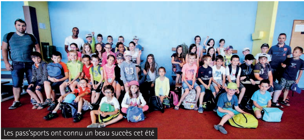
Les pass'sports ont connu un beau succès cet été