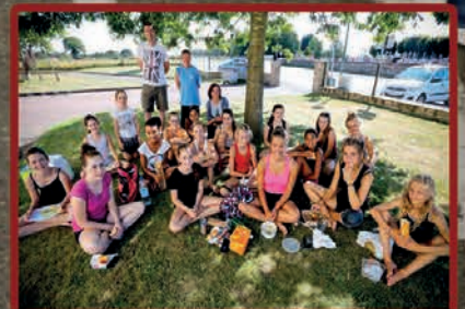
Les 30 ans du club de gym