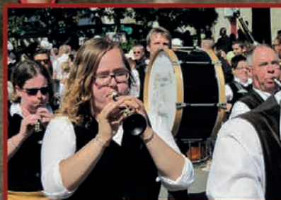
Un été très animé