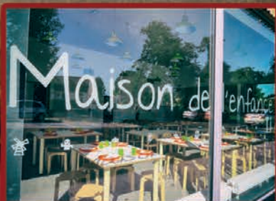
La maison de l'enfance