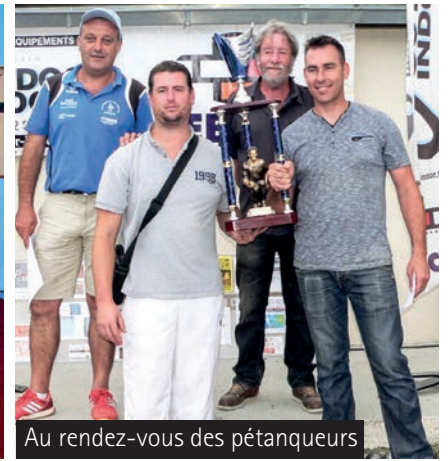
Au rendez-vous des pétanqueurs