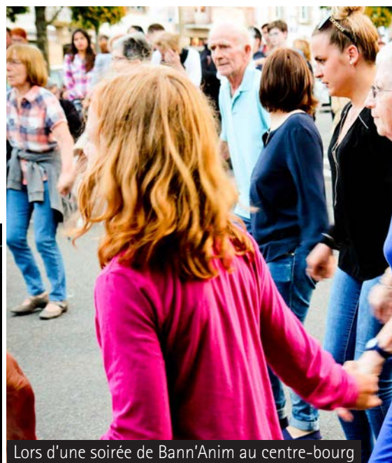
Lors d'une soirée de Bann'Anim au centre-bourg