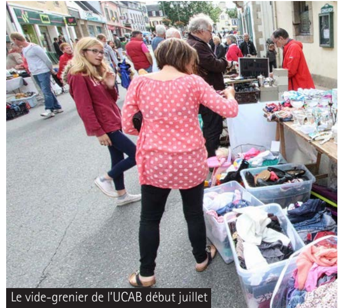
Le vide-grenier de l'UCAB début juillet