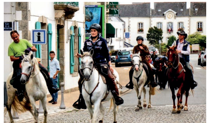
La randonnée équestre Finistours de passage au centre-bourg