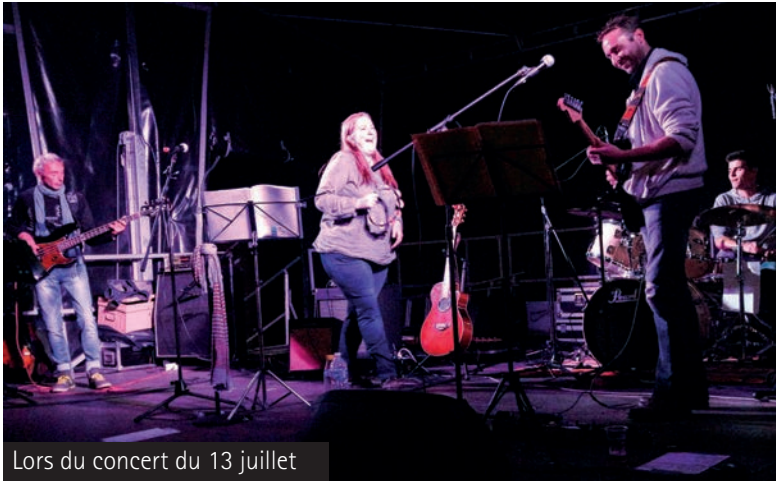
Lors du concert du 13 juillet