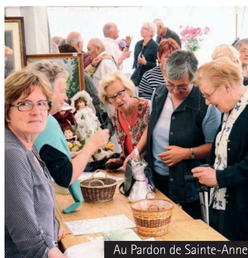
Au Pardon de Sainte-Anne