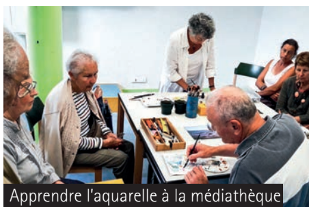
Apprendre l'aquarelle à la médiathèque