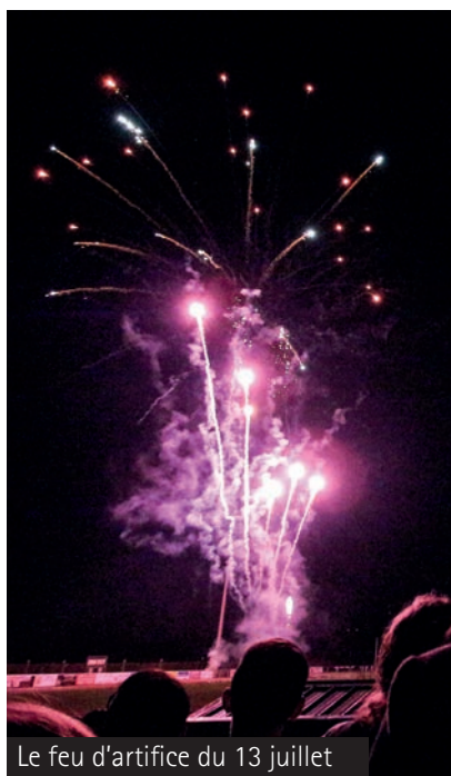
Le feu d'artifice du 13 juillet