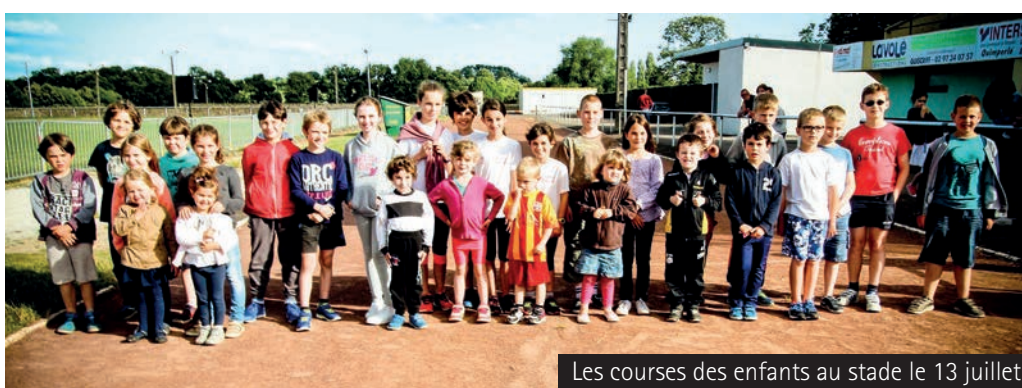
Les courses des enfants au stade le 13 juillet