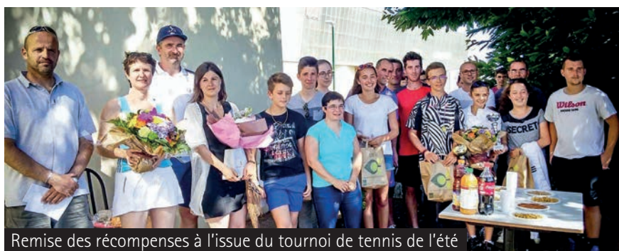
Remise des récompenses à l'issue du tournoi de tennis de l'été