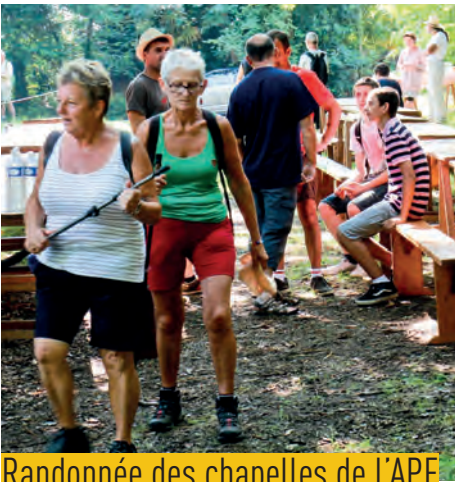
Randonnée des chapelles de l'APE