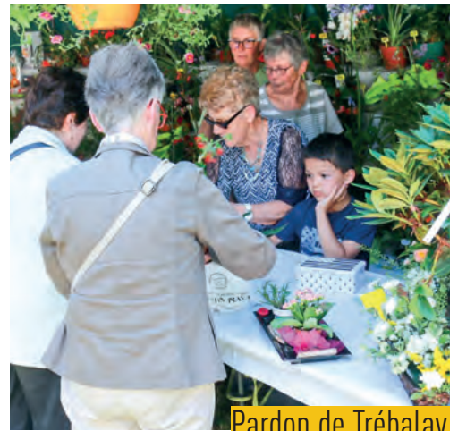
Pardon de Trébalay