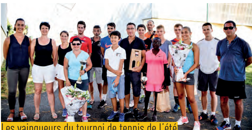
Les vainqueurs du tournoi de tennis de l'été