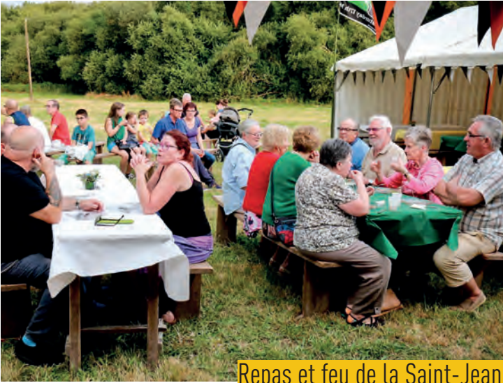
Repas et feu de la Saint-Jean