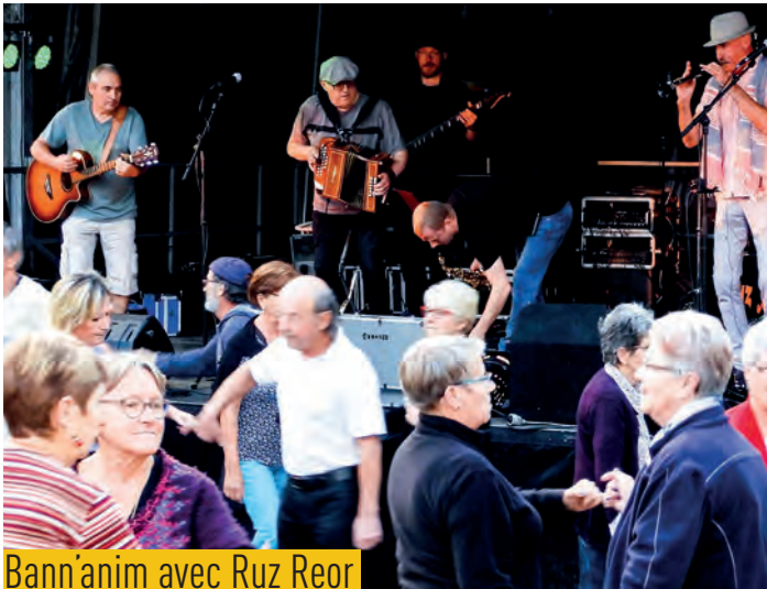
Bann'anim avec Ruz Reor