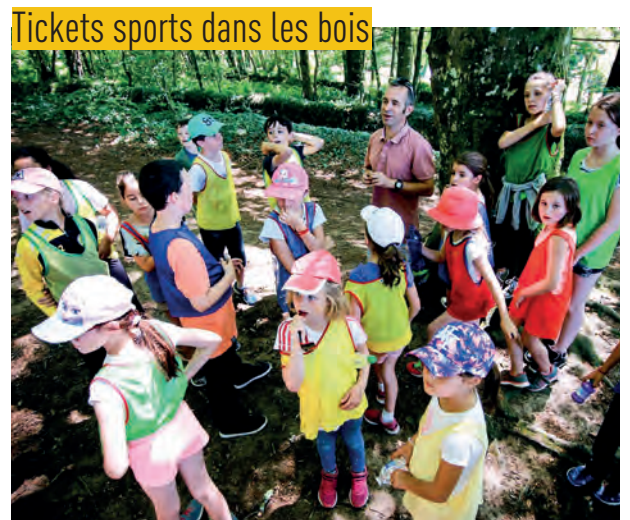
Tickets sports dans les bois