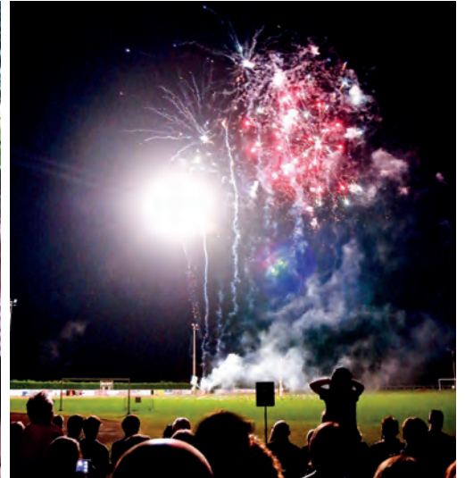
Repas, retraite aux flambeaux et feu d'artifice le 13 juillet