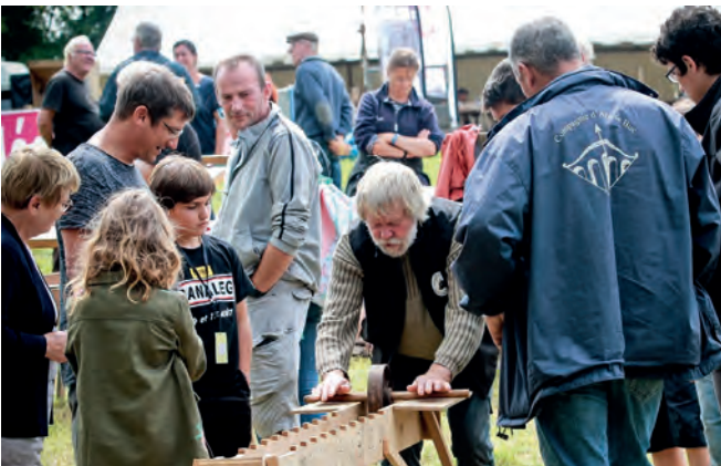
Fête folklorique et fête des vieux métiers le 15 août