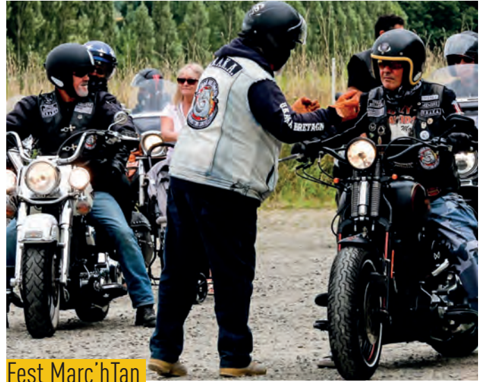
Fest Marc'h Tan