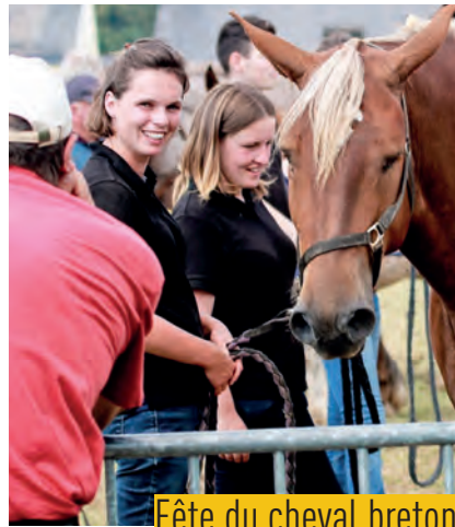
Fête du cheval breton