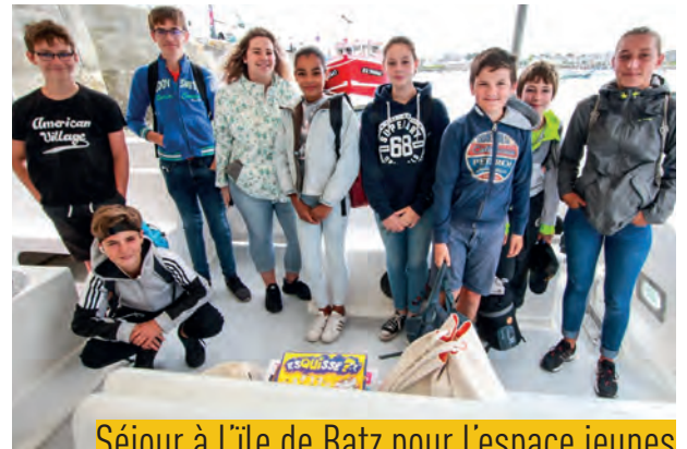
Séjour à l'île de Batz pour l'espace jeunes