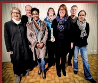
L'UCAB à l'honneur