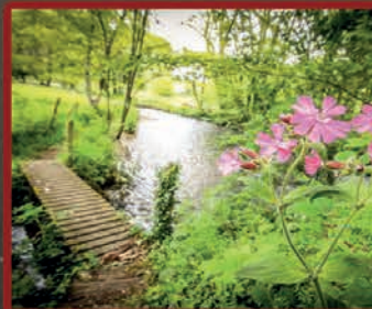
Le printemps est là