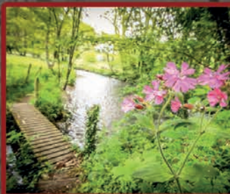
Le printemps est là