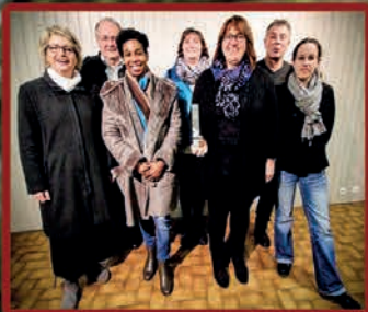
L'UCAB à l'honneur