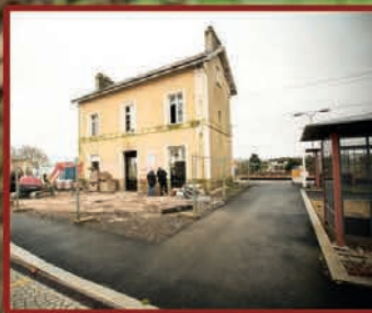
Le budget 2016