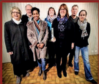
L'UCAB à l'honneur