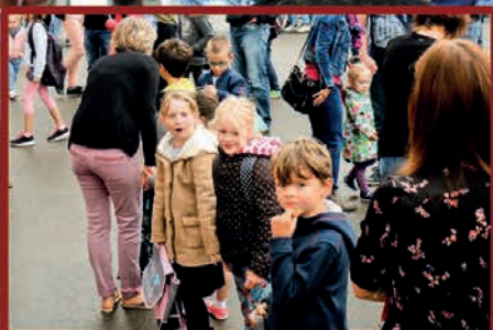
La rentrée scolaire