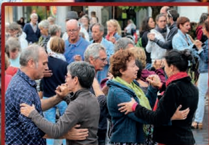
Images d'un été animé