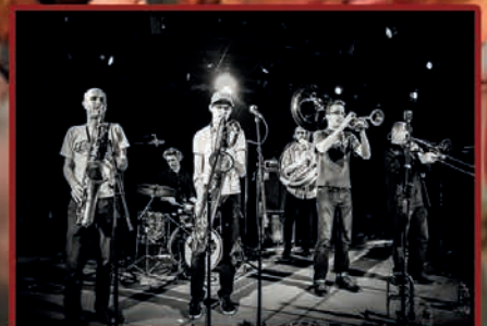
Festival Les Passeurs de lumière