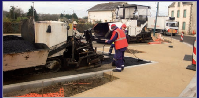
Plate-forme multimodale : réalisation des enrobés.

Alimentation de l'espace A. Duval en électricité et en éclairage public depuis le comptage général du stade : travaux réalisés en interne par les services techniques.