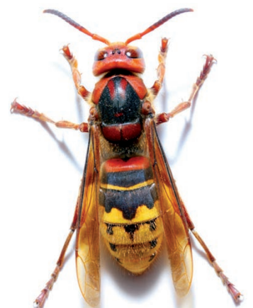
Frelon commun (jusqu'à 4 cm)