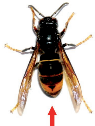
Frelon asiatique (taille réelle 3 cm)