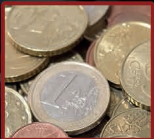
Le budget 2015

Notre dossier La musique dans tous ses états