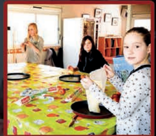
Au bonheur des TAP