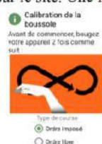
Figure 4.a : étalonnage boussole

À partir de maintenant, plus besoin d'avoir du réseau. Un écran d'étalonnage de la boussole apparaît (figure 4.a). Inutile de le faire à chaque fois. Vous pouvez choisir de parcourir le circuit en ordre libre ou imposé. Seul l'ordre imposé permet d'avoir une comparaison des performances sur le site. Une fois validé, vous arrivez sur l'écran du départ (figure 4.b).