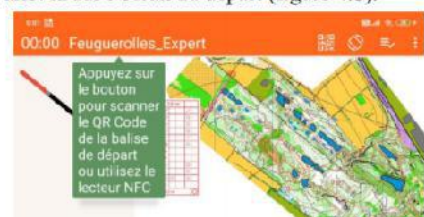
Figure 4.b : écran départ