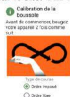
Figure 4.a : étalonnage boussole

À partir de maintenant, plus besoin d'avoir du réseau. Un écran d'étalonnage de la boussole apparaît (figure 4.a). Inutile de le faire à chaque fois. Vous pouvez choisir de parcourir le circuit en ordre libre ou imposé. Seul l'ordre imposé permet d'avoir une comparaison des performances sur le site. Une fois validé, vous arrivez sur l'écran du départ (figure 4.b).